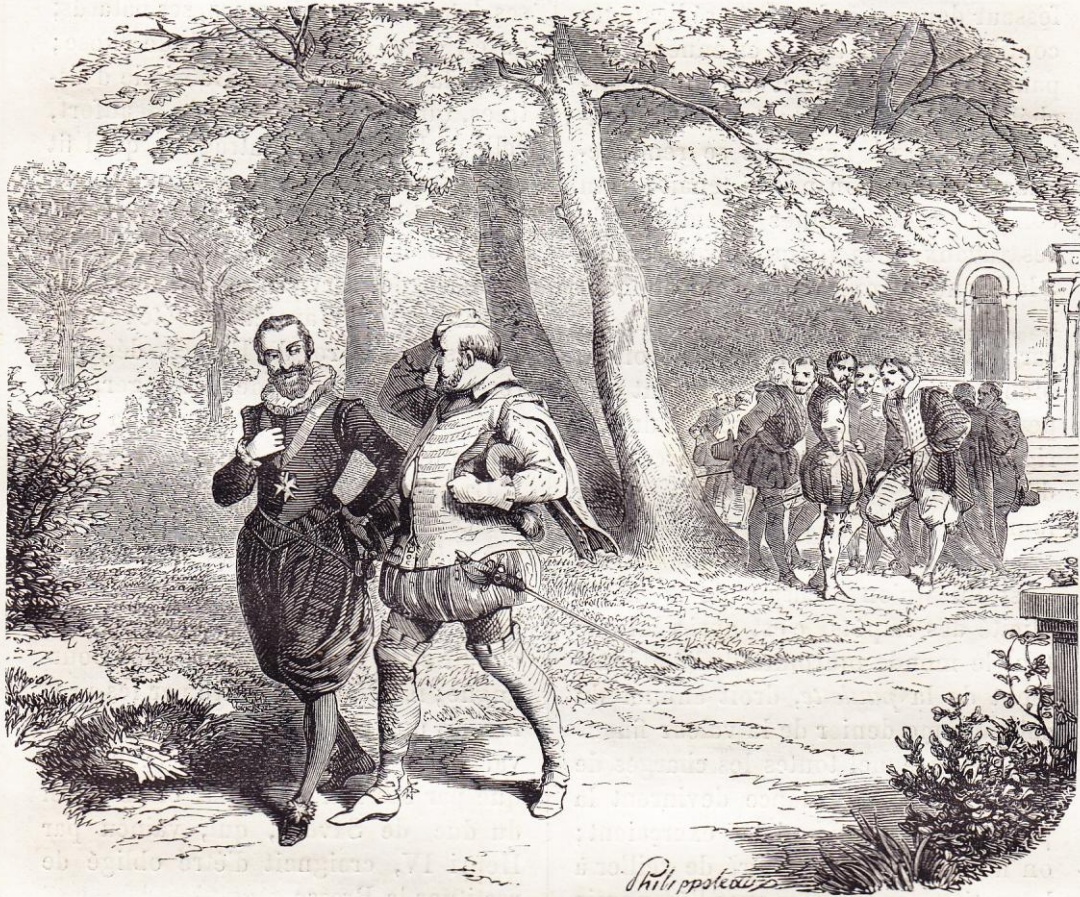
Entrevue de Henri IV et de Mayenne.

Henriette d'Entragues avait pourtant bien perdu de son influence; Henri