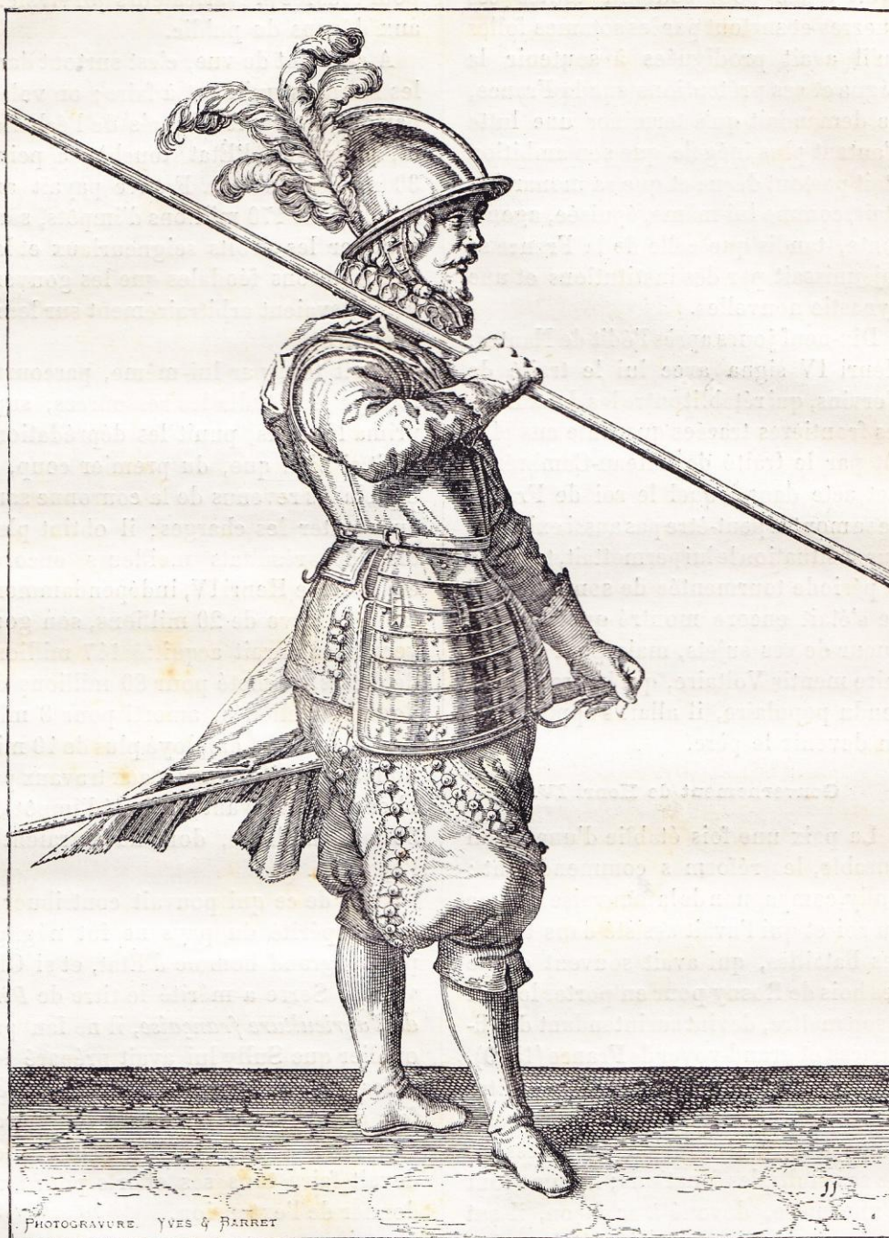
LE COSTUME MILITAIRE EN FRANCE. — Piquier sous Henri IV.

Charles-Quint, vaincu par l'Angleterre qui avait anéanti sa flotte merveilleuse, l' Invincible Armada , repoussé par les